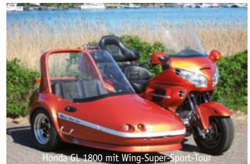
Honda GL 1800 mit Wing-Super-Sport-Tour