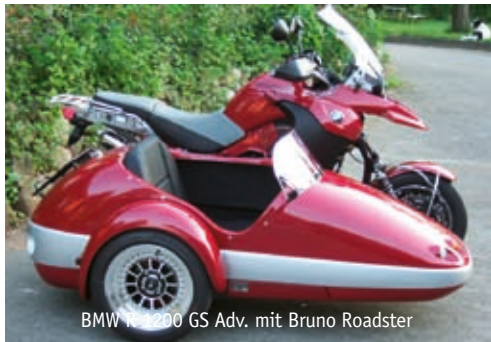
BMW R 1200 GS Adv. mit Bruno Roadster