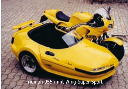
Triumph 955 i mit Wing-Super-Sport