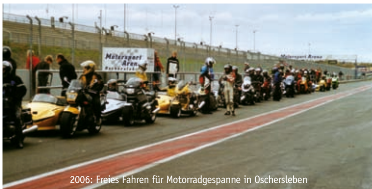
2006: Freies Fahren für Motorradgespanne in Oschersleben