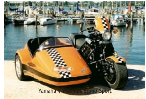
Yamaha Venture mit Bruno-Sport