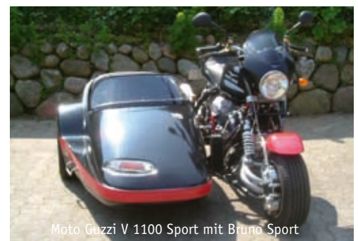
Moto Guzzi V 1100 Sport mit Bruno Sport