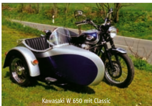
Kawasaki W 650 mit Classic