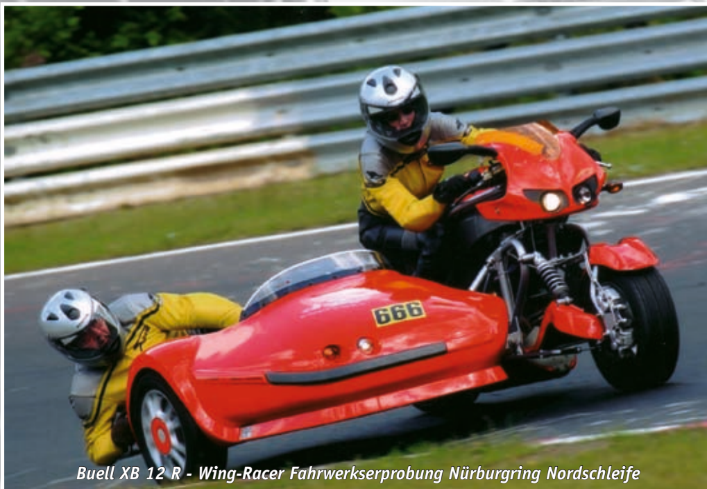
Buell XB 12 R - Wing-Racer Fahrwerkserprobung Nürburgring Nordschleife

Sauer sidecar international eine Spur besser