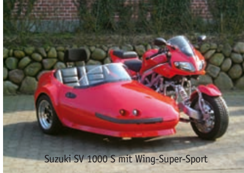
Suzuki SV 1000 S mit Wing-Super-Sport