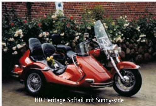
HD Heritage Softtail mit Sunny-side