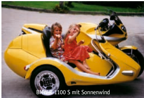
BMW R 1100 S mit Sonnenwind