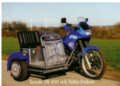
Suzuki DR 650 mit Falke-Enduro