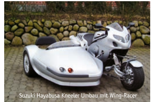
Suzuki Hayabusa Kneeler Umbau mit Wing-Racer