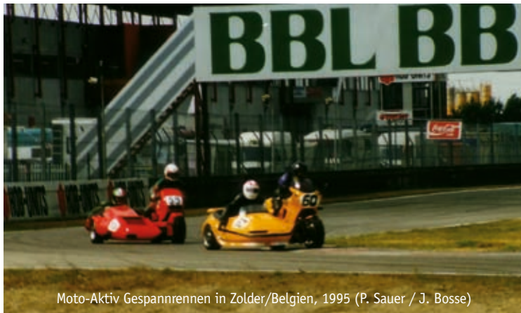
Moto-Aktiv Gespannrennen in Zolder/Belgien, 1995 (P. Sauer / J. Bosse)