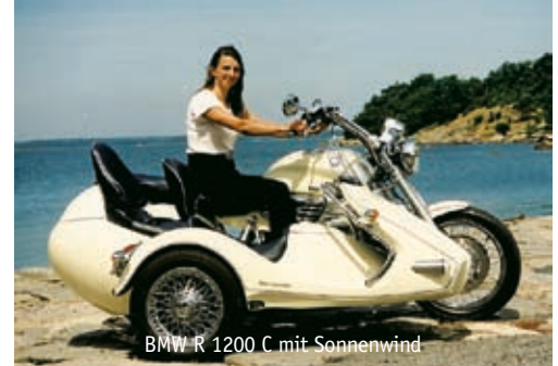
BMW R 1200 C mit Sonnenwind

Unsere Entwicklungen sind prinzipiell mit Festigkeitsgutachten und TÜV-Abnahme versehen. Das wir die verschiedenen Details zu einem homogenen Ganzen verbinden und Gespanne von höchster Qualität und Sicherheit nach individuellen Vorgaben fertigen, versteht sich dabei von selbst.