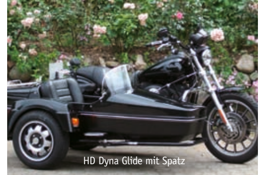
HD Dyna Glide mit Spatz