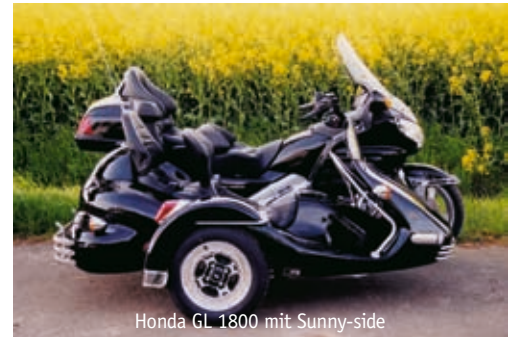
Honda GL 1800 mit Sunny-side