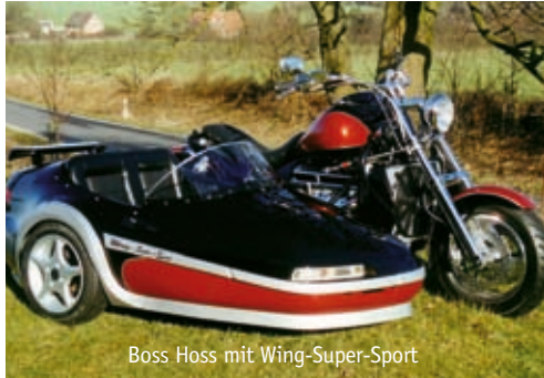
Boss Hoss mit Wing-Super-Sport