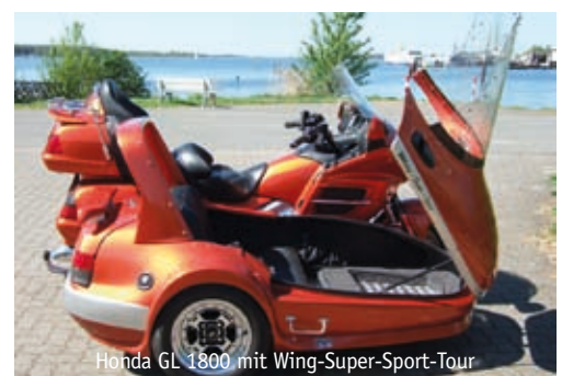
Honda GL 1800 mit Wing-Super-Sport-Tour