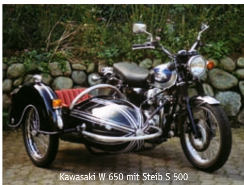
Kawasaki W 650 mit Steib S 500