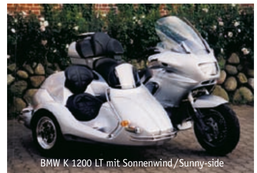
BMW K 1200 LT mit Sonnenwind/Sunny-side