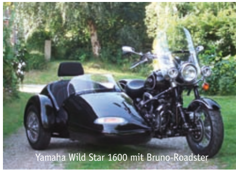
Yamaha Wild Star 1600 mit Bruno-Roadster