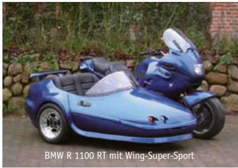
BMW R 1100 RT mit Wing-Super-Sport