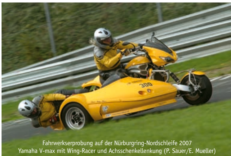
Fahrwerkserprobung auf der Nürburgring-Nordschleife 2007 Yamaha V-max mit Wing-Racer und Achsschenkellenkung (P. Sauer/E. Mueller)