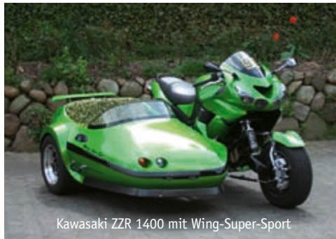
Kawasaki ZZR 1400 mit Wing-Super-Sport