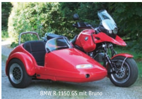
BMW R 1150 GS mit Bruno