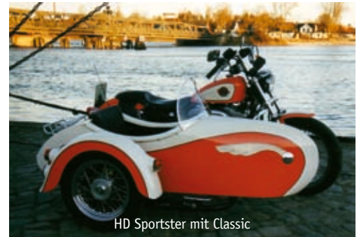
HD Sportster mit Classic