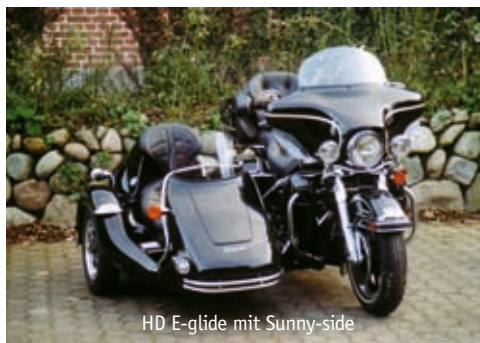
HD E-glide mit Sunny-side