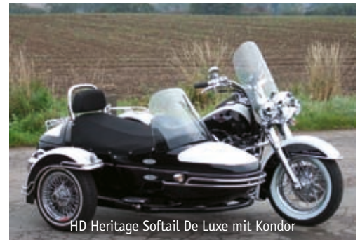
HD Heritage Softtail De Luxe mit Kondor