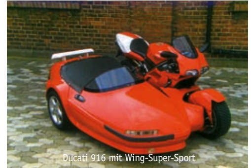
Ducati 916 mit Wing-Super-Sport