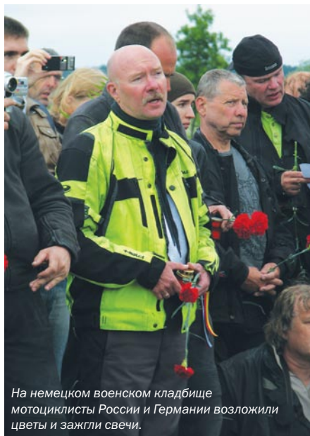
На немецком военном кладбище мотоциклисты России и Германии возложили цветы и зажгли свечи.