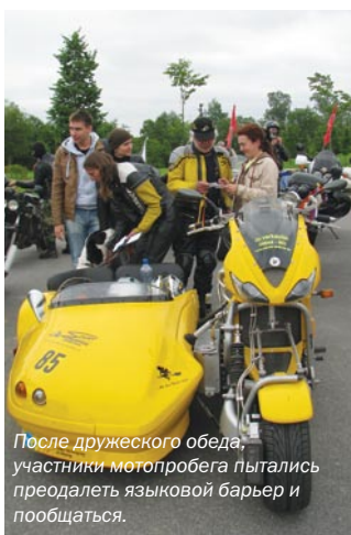
После дружеского обеда, участники мотопробега пытались преодолеть языковой барьер и пообщаться.