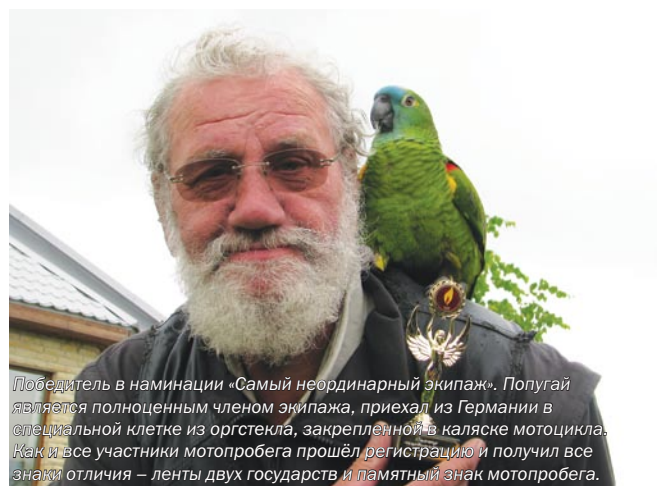
Победитель в номинации «Самый неординарный экипаж». Попугай является полноценным членом экипажа, приехал из Германии в специальной клетке из оргстекла, закреплённой в коляске мотоцикла. Как и все участники мотопробега прошёл регистрацию и получил все знаки отличия – ленты двух государств и памятный знак мотопробега.