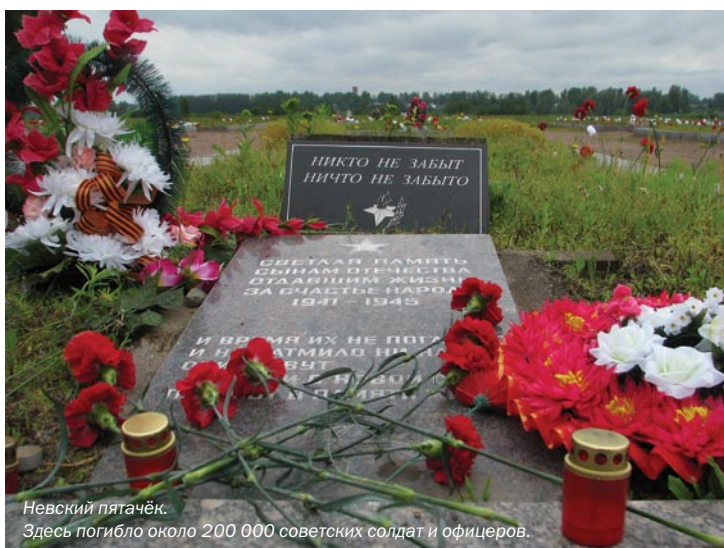
Невский пятачек. Здесь погибло около 200 000 советских солдат и офицеров.