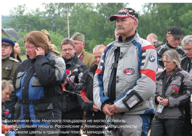
Возжжённое поле Невского плацдарма не могло оставить равнодушными никого. Российские и Немецкие мотоциклисты возложили цветы к гранитным плитам мемориала.