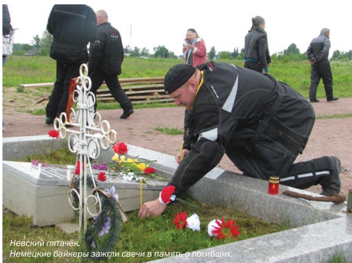
Невский пятачек. Немецкие байкеры зажгли свечи в память о погибших.